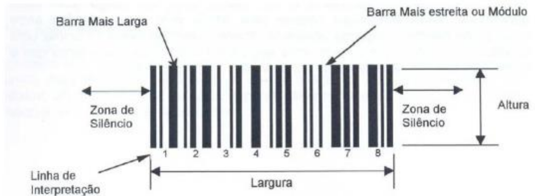
Figura ... – Estrutura de um código de barras

Segundo Albareda et. al. (2007), o código de barras é composto pelos elementos a seguir: